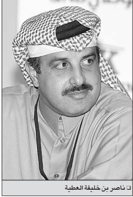
ناصر بن خليفة العطية